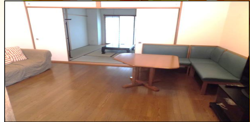
314号室の和室とリビングルーム