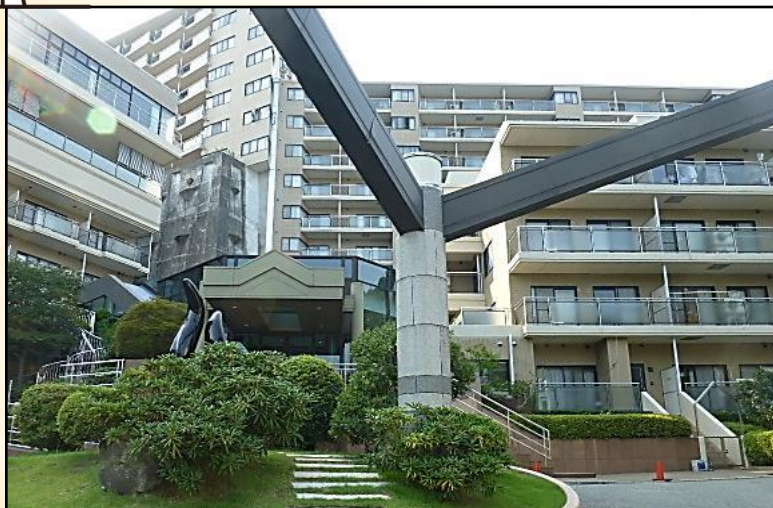
サニークレスト伊東の建物正面