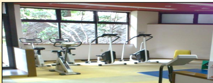
トレーニングジム