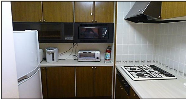
各戸の調理器具 食器