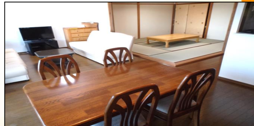
1109号室のリビングルームと和室