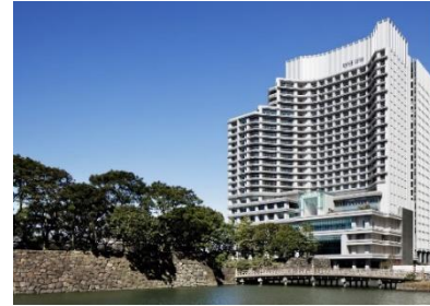
パレスホテル東京